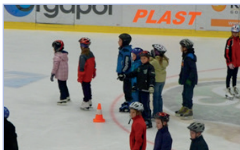
Bruslení DRFG Arena