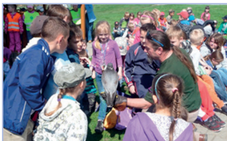
IKAROS- vzdělávací program