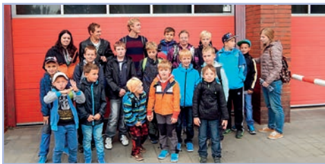
Výlet Mladých hasičů na PS Brno Lidická

všem normám, které jsou v dnešní době požadovány.