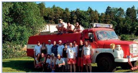
Dětský den - Olympiáda Nesovice 2015

Doufáme, že v průběhu oslav nám bude obcí předán nový dopravní automobil pro činnost JSDH. Tento vůz bude pořízen z již přiznané dotace od Jihomoravského kraje a z velké části z rozpočtu Obce Nesovice. Auto bude vybaveno pro potřeby záahové jednotky tak, aby odpovídalo