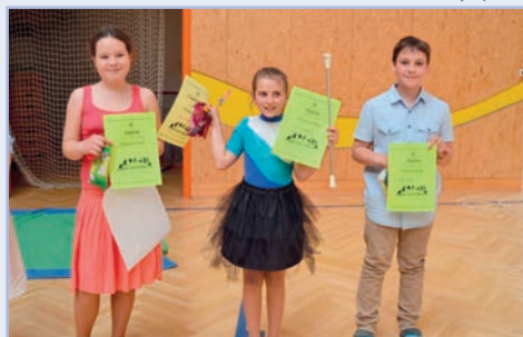
Náš škola má talent