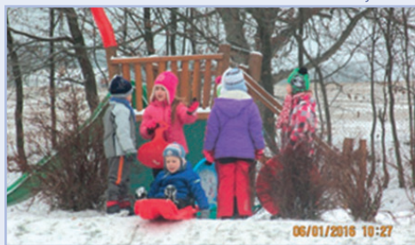
Radováanky na školní zahradě