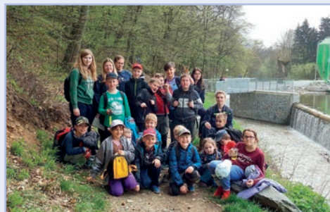
MLADÍ HASIČI - BRANNÝ ZÁVOD PÍSTOVICE 2016