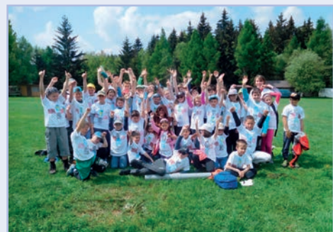
Škola v přírodě