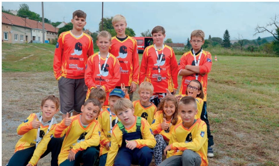
MLADÍ HASIČI SDH NESOVICE - NOVÉ DRESY - 120 LET ZALOŽENÍ SBORU