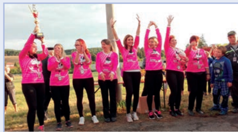
DRUŽSTVO ŽEN SDH NESOVICE - 1. MÍSTO POŽÁRNÍ ÚTOK - 120 LET ZALOŽENÍ SBORU