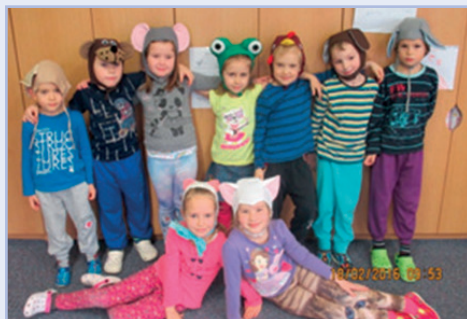
Děti hrají divadlo