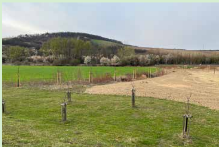
realizace výsadby ovocného sadu v Letošově