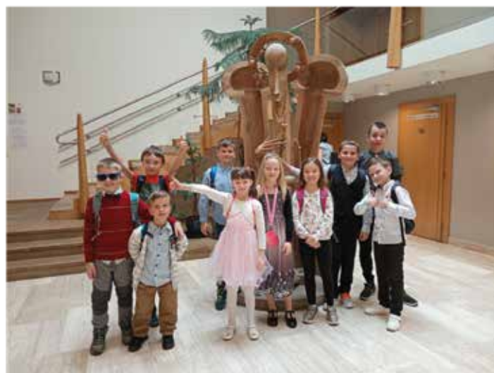
Divadlo Radost Brno