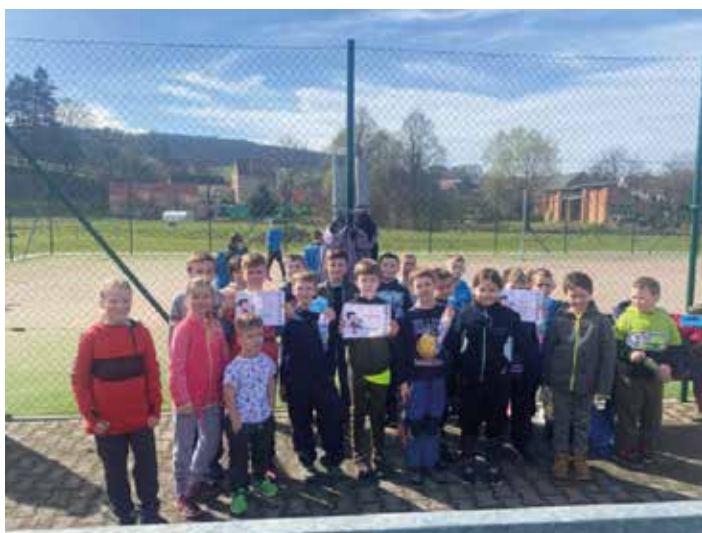
McDonald Cup - školní kolo