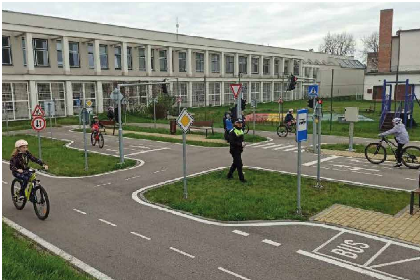
Dopravní hřiště Vyškov