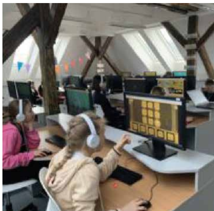
Testování nadaných žáků