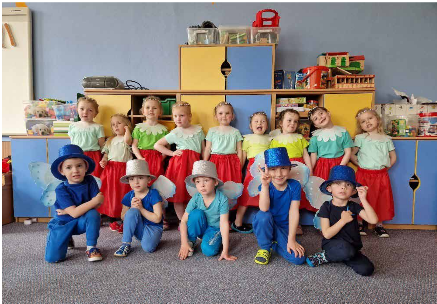
Berušky pro maminky - Maková panenka a motýl Emanuel

zvem Myši patří do nebe. Březen je měsícem knihy a tak jsme se opět mohli vydat do místní knihovny, do které opakovaně a rádi chodíme. Paní knihovnice si pro nás nachystaly knižní novinky, zábavný kvíz i hlavolamy. Děti debatovaly nad knihami, prohlížely si obrázky a vybraly knihy, které si půjčily do školky. Rovněž jsme přijali pozvání do základní školy, kde se uskutečnil tanečním program Doctor Dancer „Záchrana země“. Děti se vlnily v rytmu hudby a naučily se zajímavé taneční kreace. Zimy už bylo dost, a tak jsme se s dětmi snažili přivolat jaro. Všichni si vyrobili malé Morany a tygřici k tomu vyrobili ještě velkou. Společným průvodem jsme se vydali k potoku kde jsme je poslali po proudu. Ještě před velikonočními svátky se ve školce uskutečnilo pečení s babičkami. Ty společně s dětmi připravily nadýchané jidáše a mazance. Odpoledne proběhla velikonoční dílna pro rodiče s dětmi. Vyrobit si mohli skleničku ozdobenou ubrouskovou technikou a zápich se skořápkou do květináče a naladit se tak na přicházející Velikonoce. Duben ve školce začal barevně. Barevný týden byl ve znamení modré, žluté, červené a zelené. Děti tak uctily velikonoční tradice. Tygřici přijali pozvání od paní učitelky Zezulové a navštívili děti v první třídě. Vyzkoušeli si, jak se sedí v lavici, vypracovali pracovní list a v tělocvičně si vyzkoušeli samohybné autíčko. V mateřské