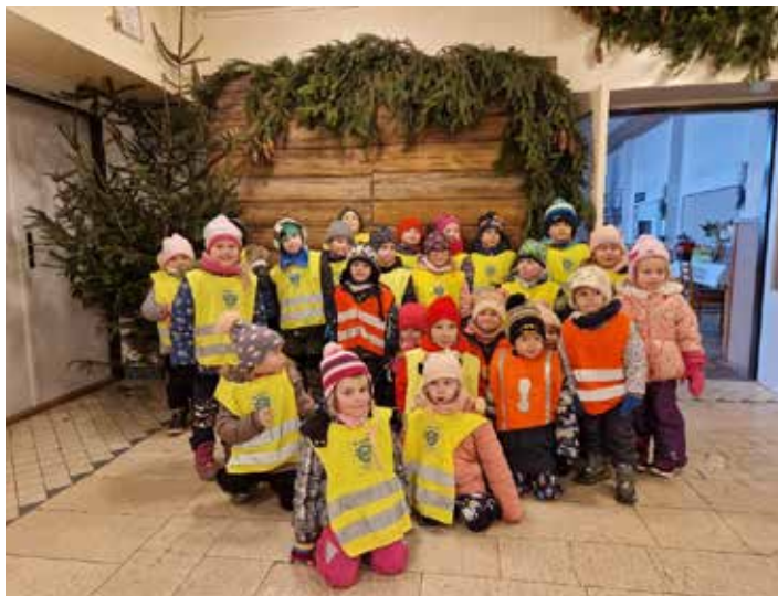
Příprava sálu na myslivecký ples