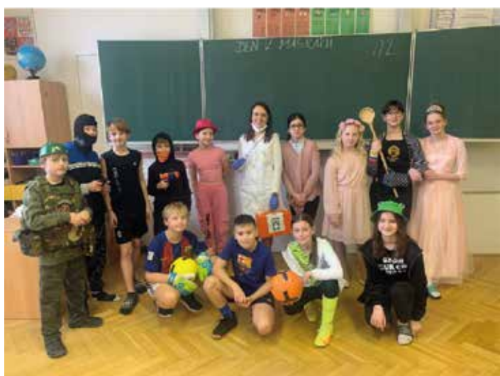
Den v maskách