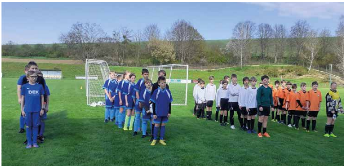
McDonald Cup - okrskové kolo