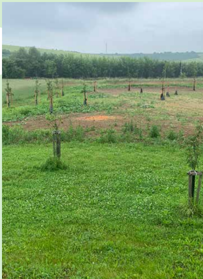
výsadba ovocného sadu v Letošově