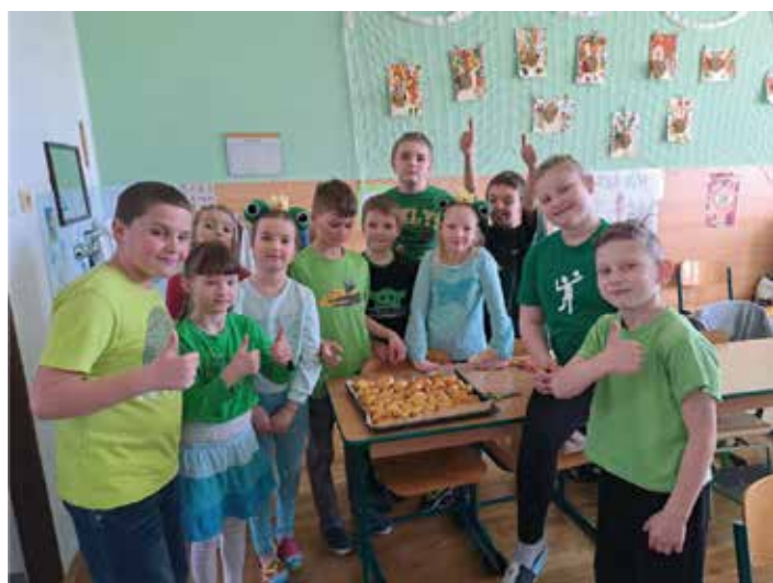
Pečení Velikonočních jidášů