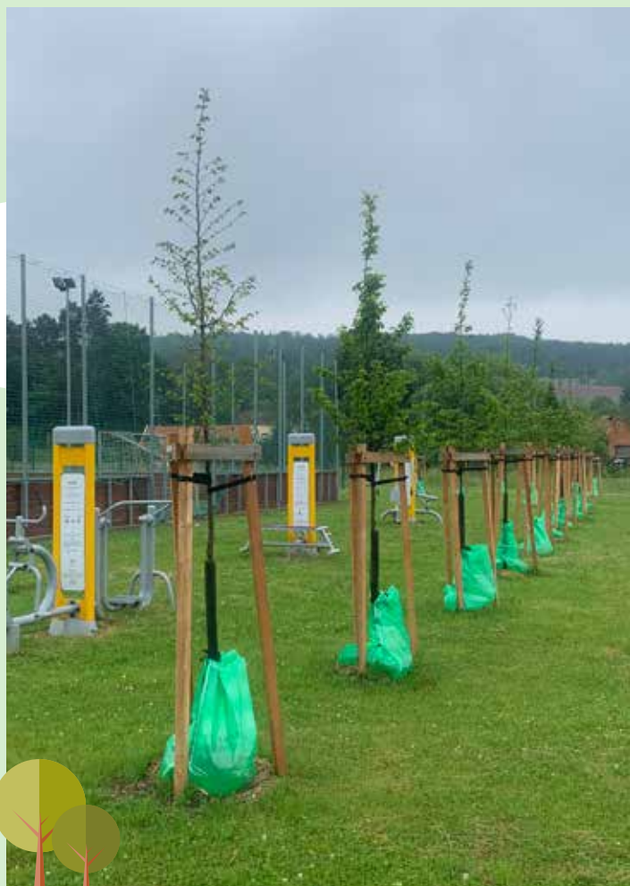
výsadba okrasných stromů u sportoviště