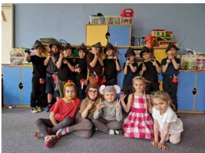
Tygríci pro maminky - Zvířátka a loupežníci