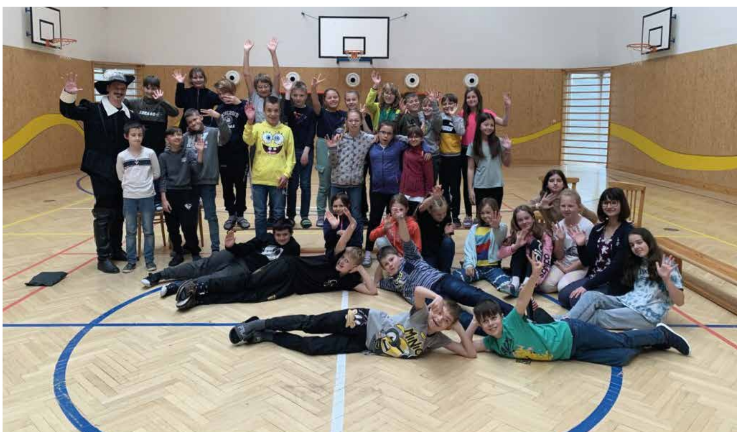
Projektový den regionální historie