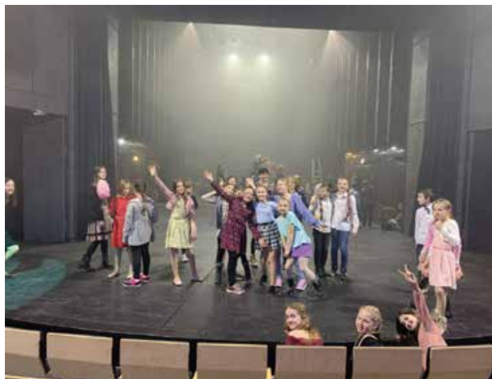
Divadlo Reduta Brno