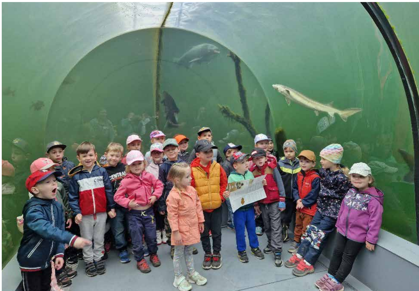
Živá voda Modrá