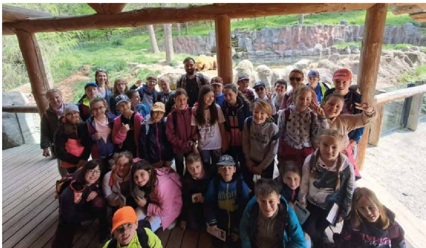
Projektový den - Animals in the ZOO