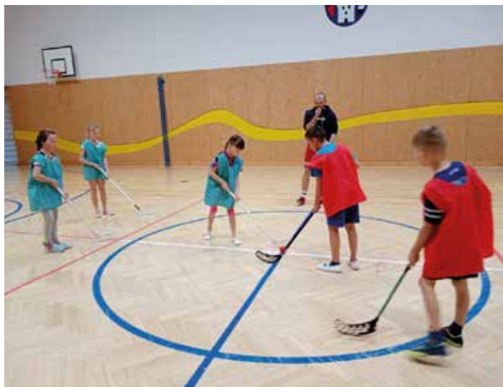
Florbalový turnaj ve škole