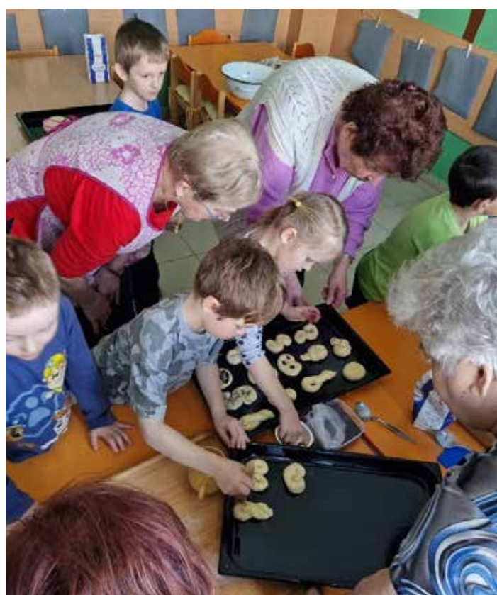
Velikonoční pečení s babičkami