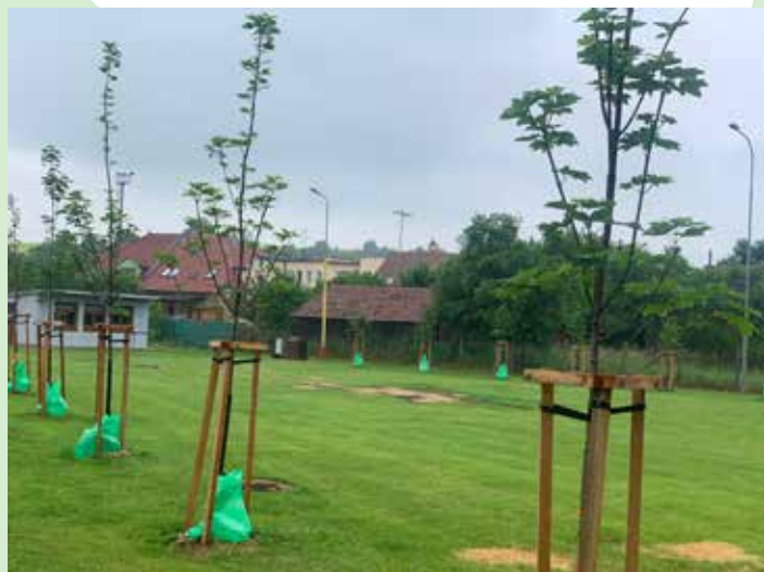
výsadba okrasných stromů v areálu u hřiště