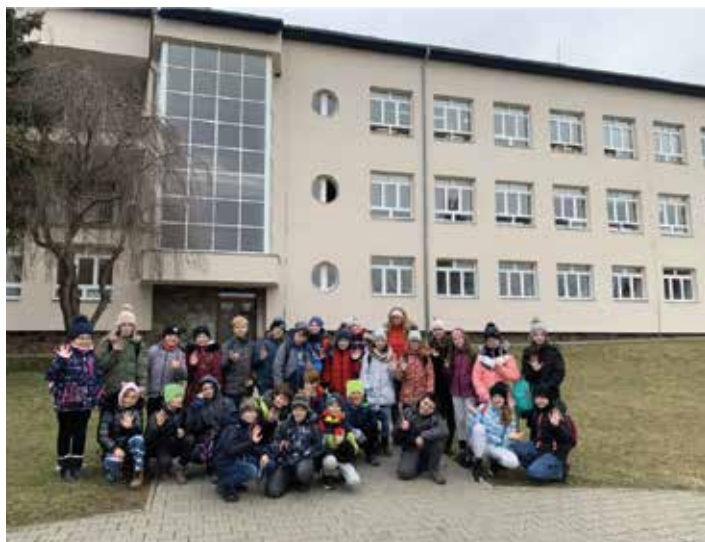
Návštěva ZŠ Brankovice