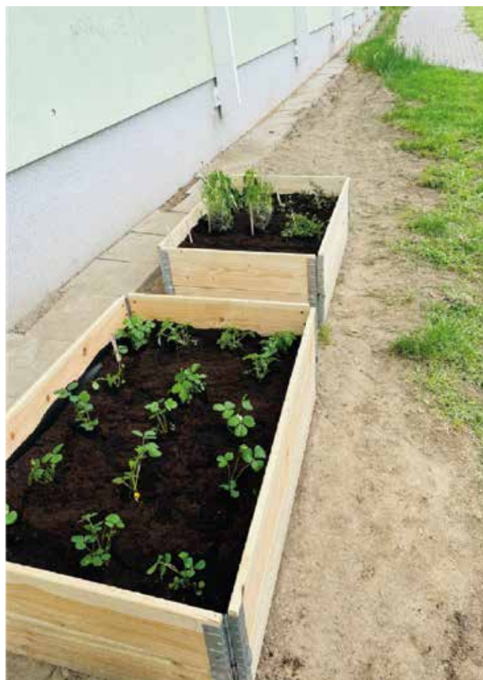
Realizace bylinkové zahrádky