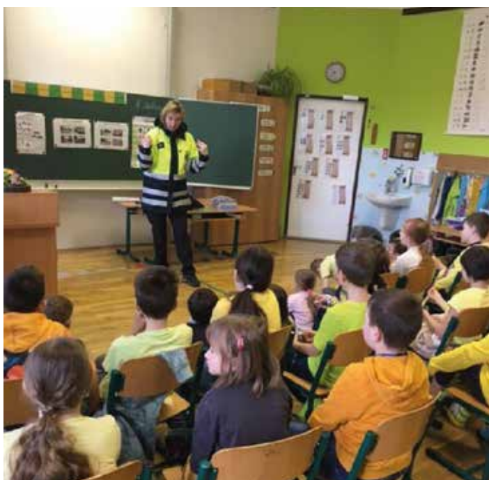
Beseda s policistkou