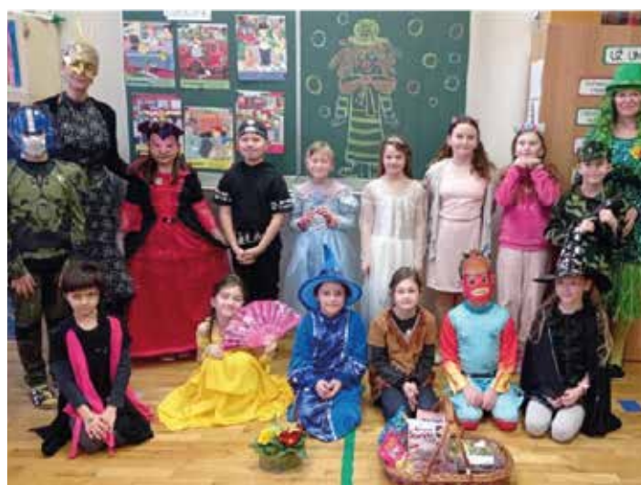
Den v maskách