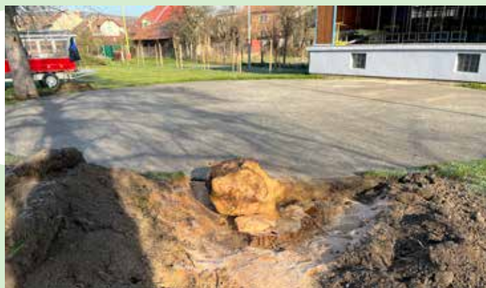
realizace výsadby v areálu u hřiště