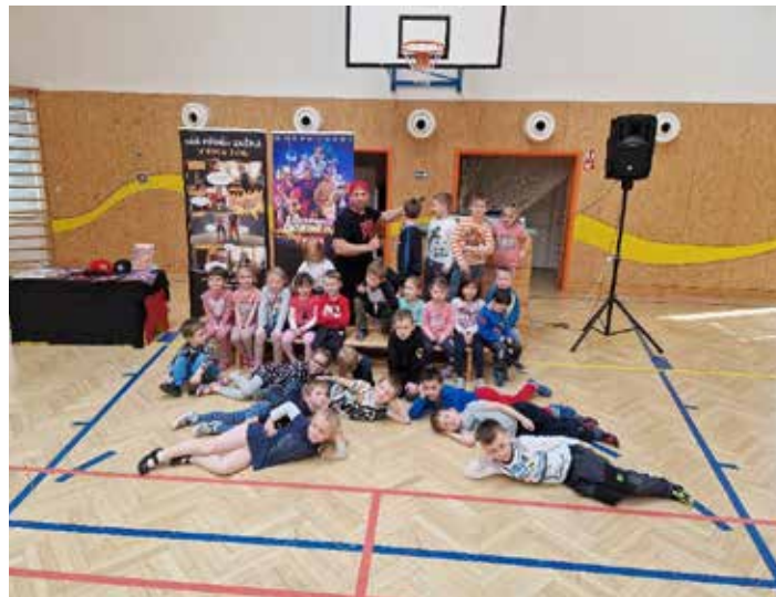
Tanečně - zábavný program v ZŠ