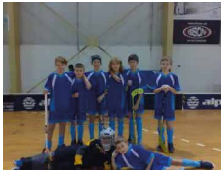
Florbalový turnaj - krajské kolo