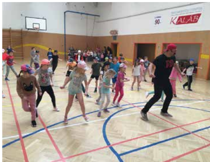
Taneční výuka Doctor Dancer