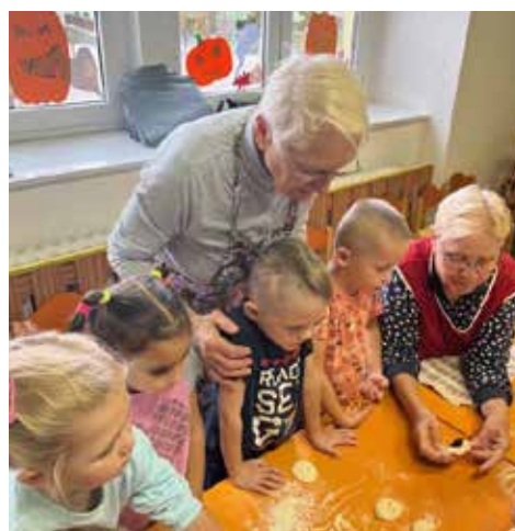
Pečení s babičkami