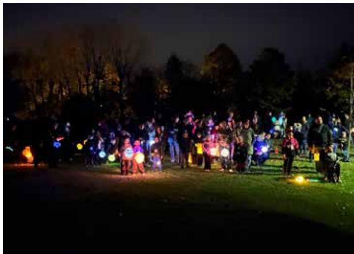
Lampionový průvod k rybníku