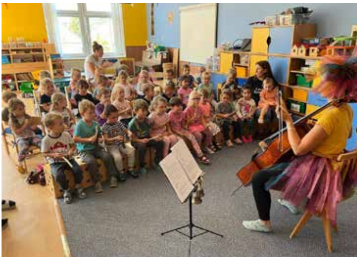
Hudební pohádka – O perníkové chaloupce