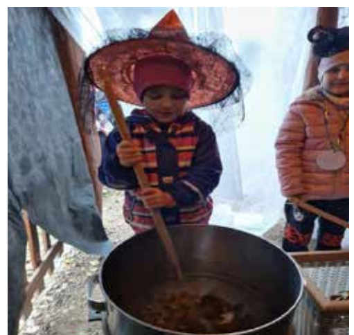
Děti míchají kouzelné lektvary