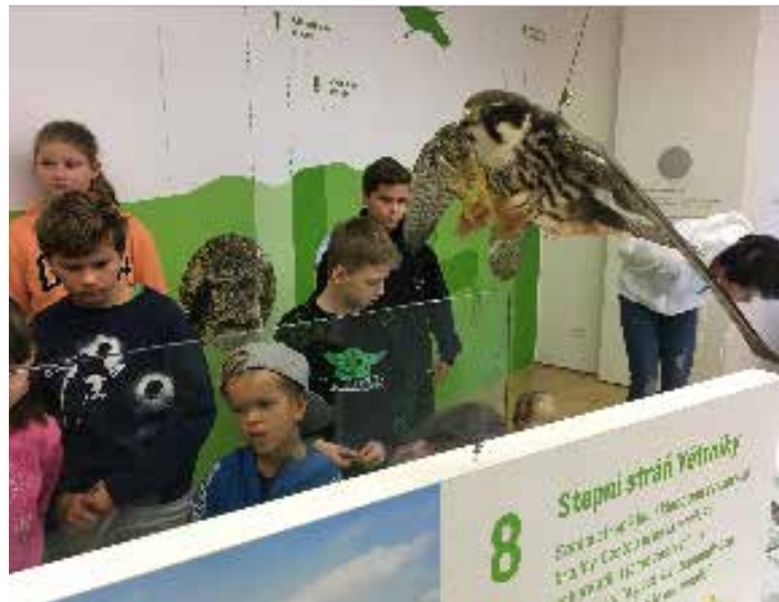
Návštěva muzea ve Vyškově