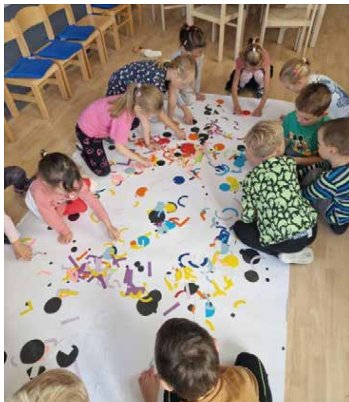
Projektový den s knihou – Linka bod