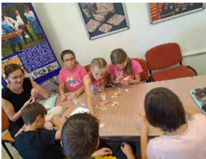
Návštěva muzea v Kyjově