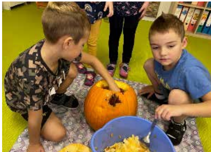
Děti připravují dýňová strašidla