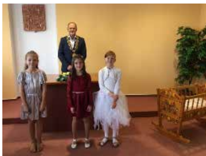
Vítání malých občáňků