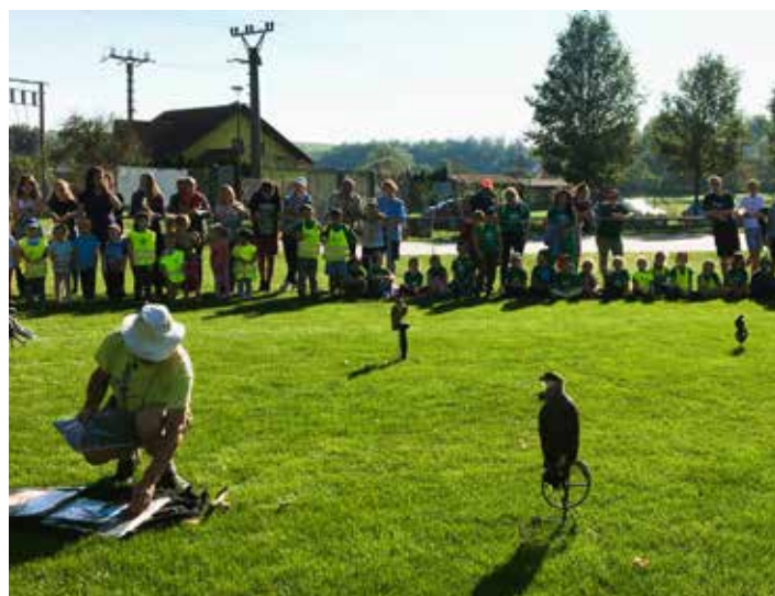
Letové ukázký dravců – Zayferus