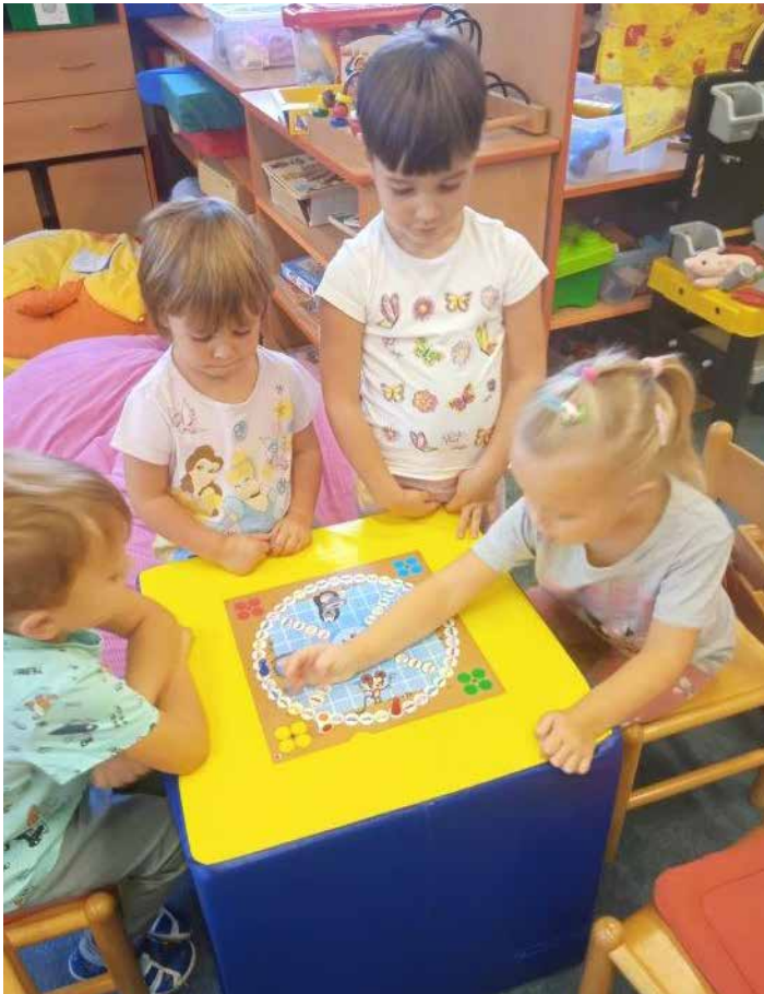
Děti hrají společenské hry