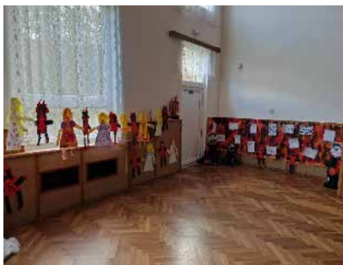
Výtvarné práce dětí na Kateřinské „oldies“ party