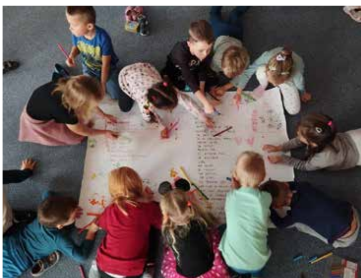
Společná práce dětí na téma Čert a Káča