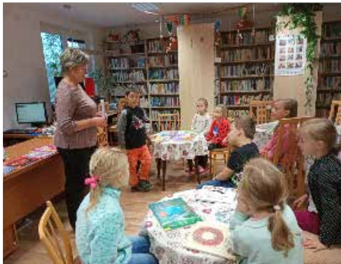
Návštěva knihovny našimi nejmenšími