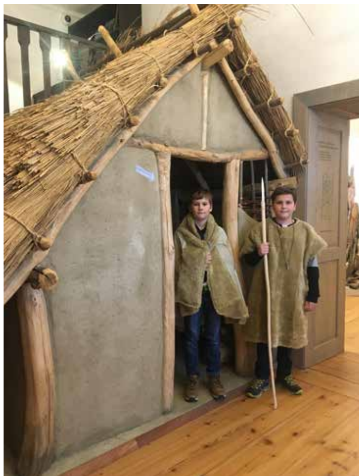
Návštěva muzea v Bučovicích