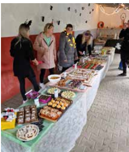
Dobroty na zahradní slavnost