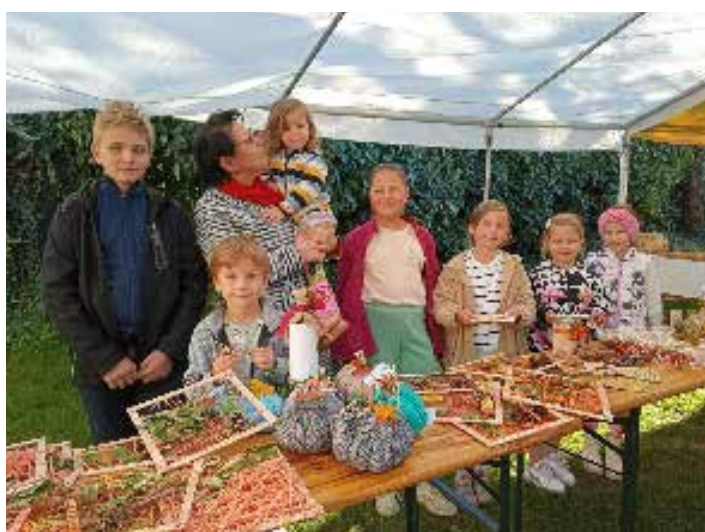
Misijní jarmark v Milonicích