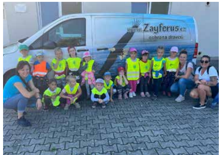
Letové ukázky dravých ptáků