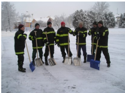
Úklid sněhové nadílky