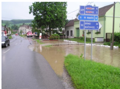
Povodně květen a červen 2010.

Protože se blíží konec roku a čas vánoční, chtěl bych poděkovat všem těm, kteří nám v letošním roce byli nakloněni a nápomocni, popřát krásné prožití svátků vánočních, hodně dárků pod stromečkem a ještě více zdraví, štěstí a pracovních úspěchů v novém roce 2011.