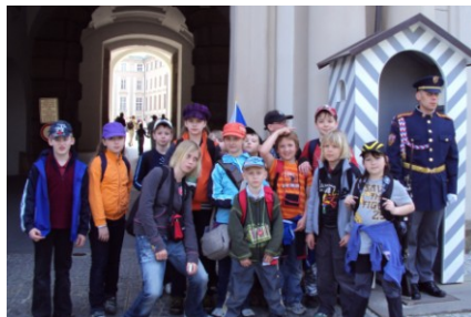
Z návštěvy Pražského hradu