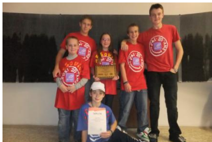
Finále soutěže ve Frýdku-Místku