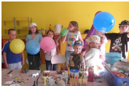
Loučení se školním rokem