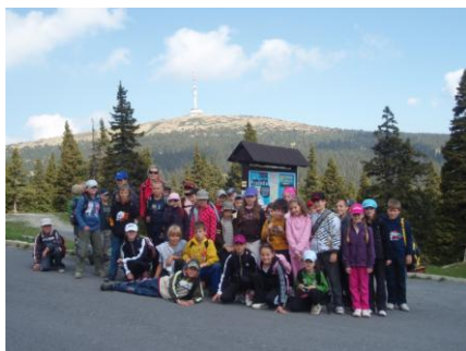
Výlet na Praděd