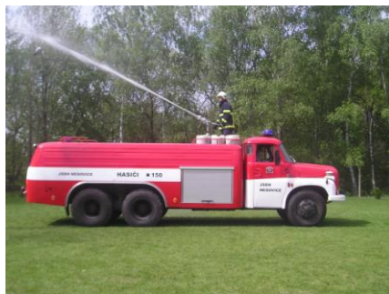
Námětové cvičení Bučovice