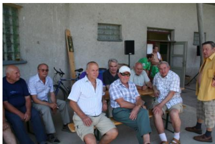
Z oslav 80. výročí kopané v Nesovicích