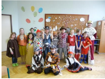
Den v maskách