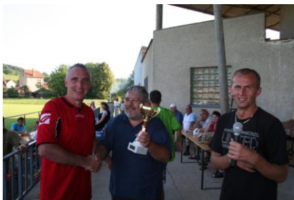
Přátelé ze Slovenska