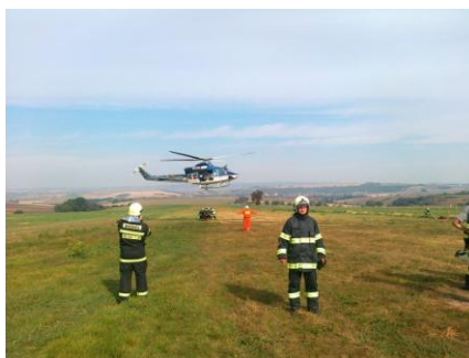
Námětové cvičení v rámci JMK