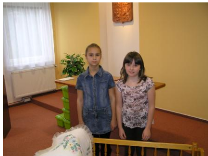
a základní školy