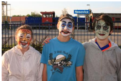
malování na obličeje