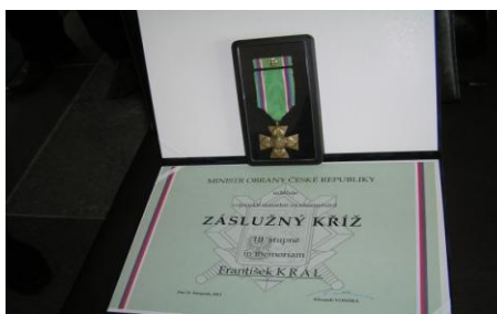
Záslužný kříž III. stupně