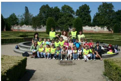
výlet do Bučovic