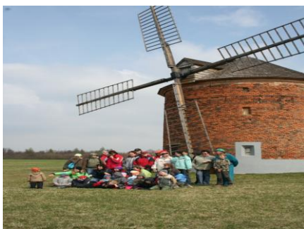
pěší túra k větrnému mlýnu