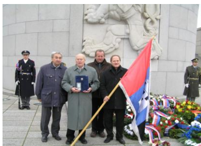
U Národního památníku na Vítkově