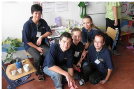
finále v Litomyšli

Naše fotografie a články najdete na: http://kmdnesovice.rajce.idnes.cz nebo www.debruar.cz