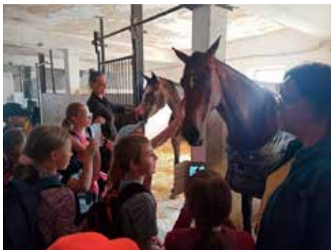
Na farmě 3. třída