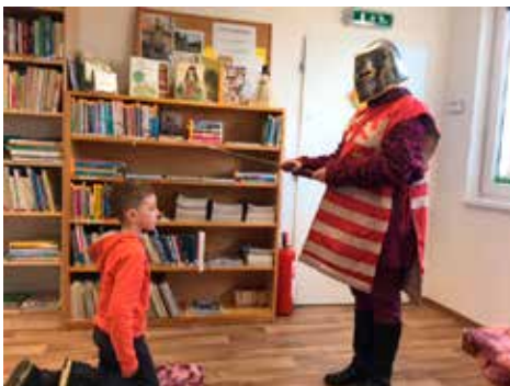
Pasování na čtenářě