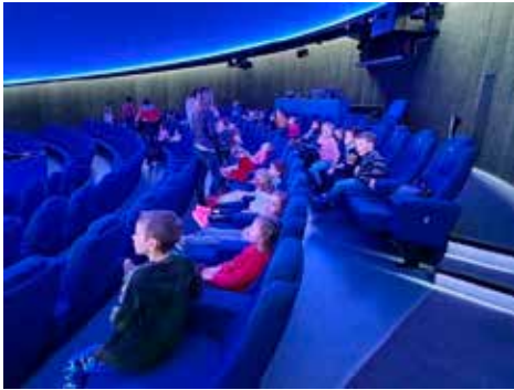
Hvězdárna a planetárium Brno