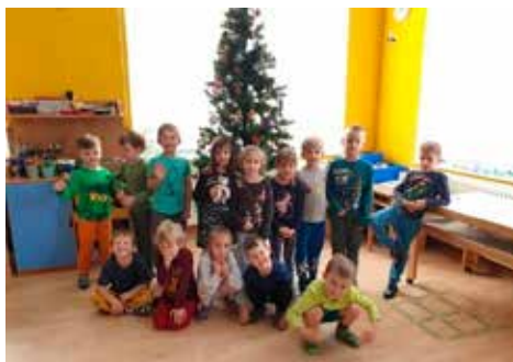
Vánoce v Tygříkách