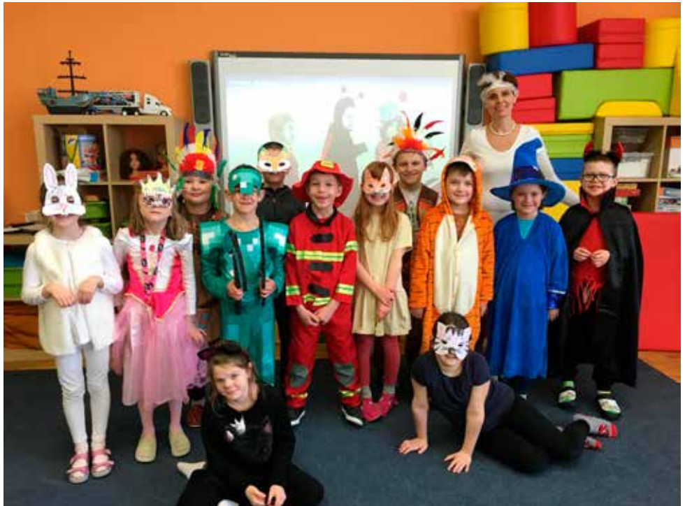
Den v maskách