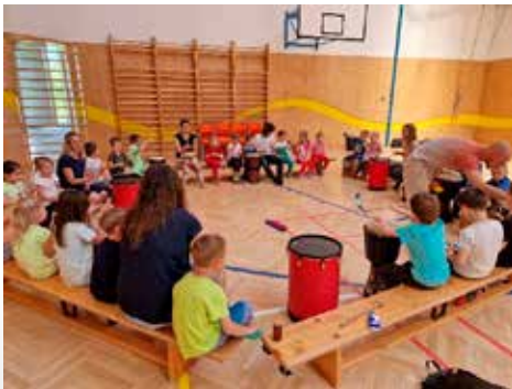
Den dětí - bubnování