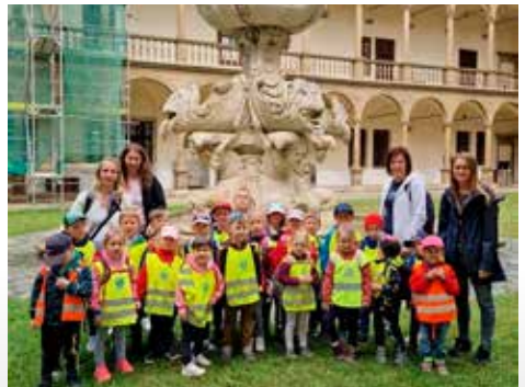
Výlet - zámek Bučovice