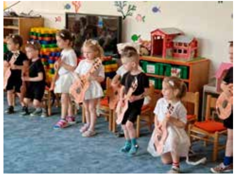
Maminka má svátek