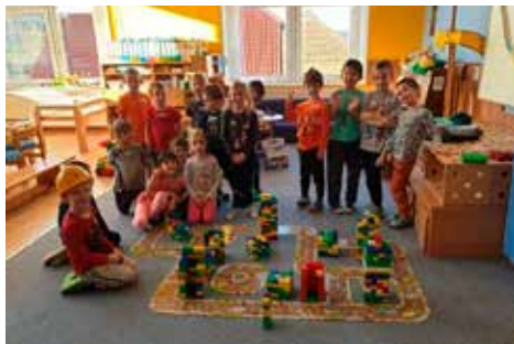
Malá technická univerzita