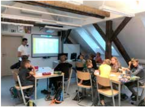
Projektový den ve 4. třídě – finanční gramotnost