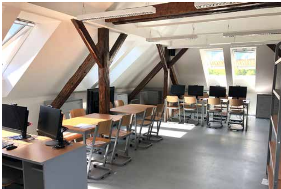
Nová učebna ZŠ