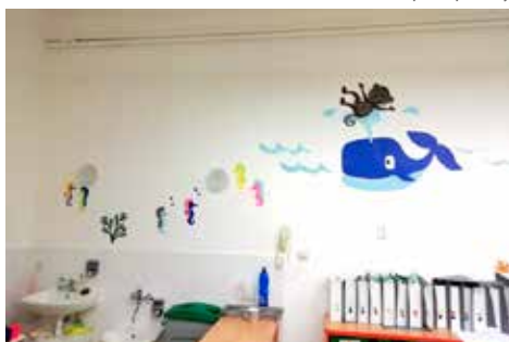
Po opravě třídy Berušek