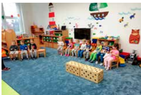
S písničkou „Když jsem já sloužil„