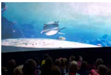
Podmořský svět v planetáriu