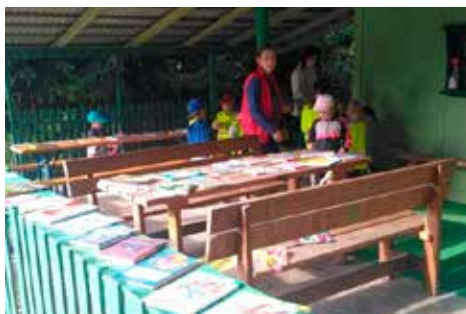
Knihovna v přírodě