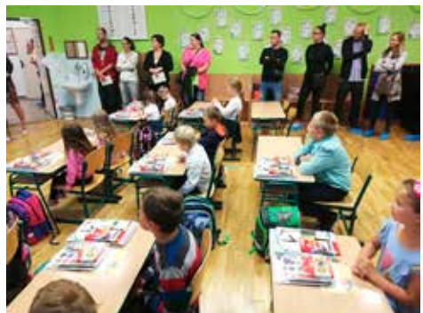
1. školní den