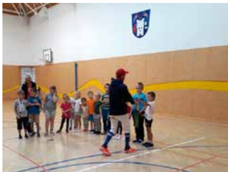
Baseball do škol v 1.třídě