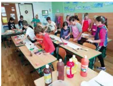
Tvoříme ve 3. třídě