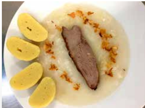
Svatomartinský oběd pro děti