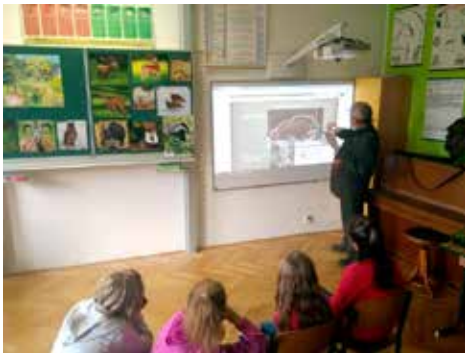
Myslivost- projektový den v 5. třídě