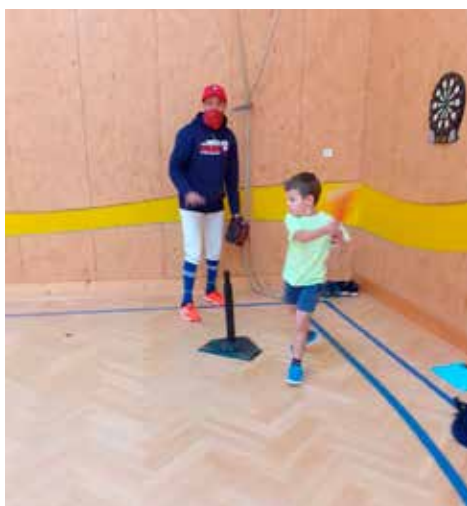
Baseball do škol ve 2. třídě