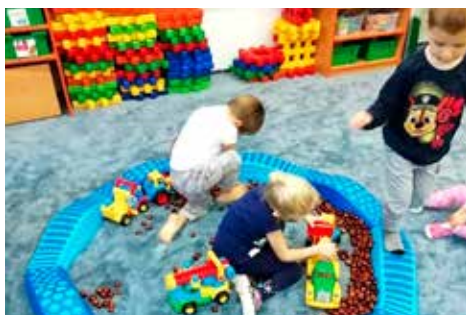
Hrátky s kaštaný