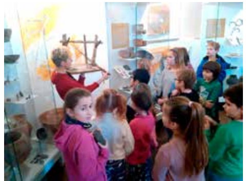
Pátáci v Muzeu Vyškov