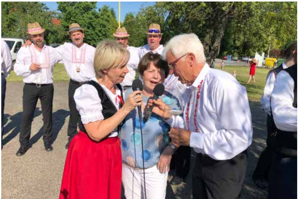
Vzpomínka na hody