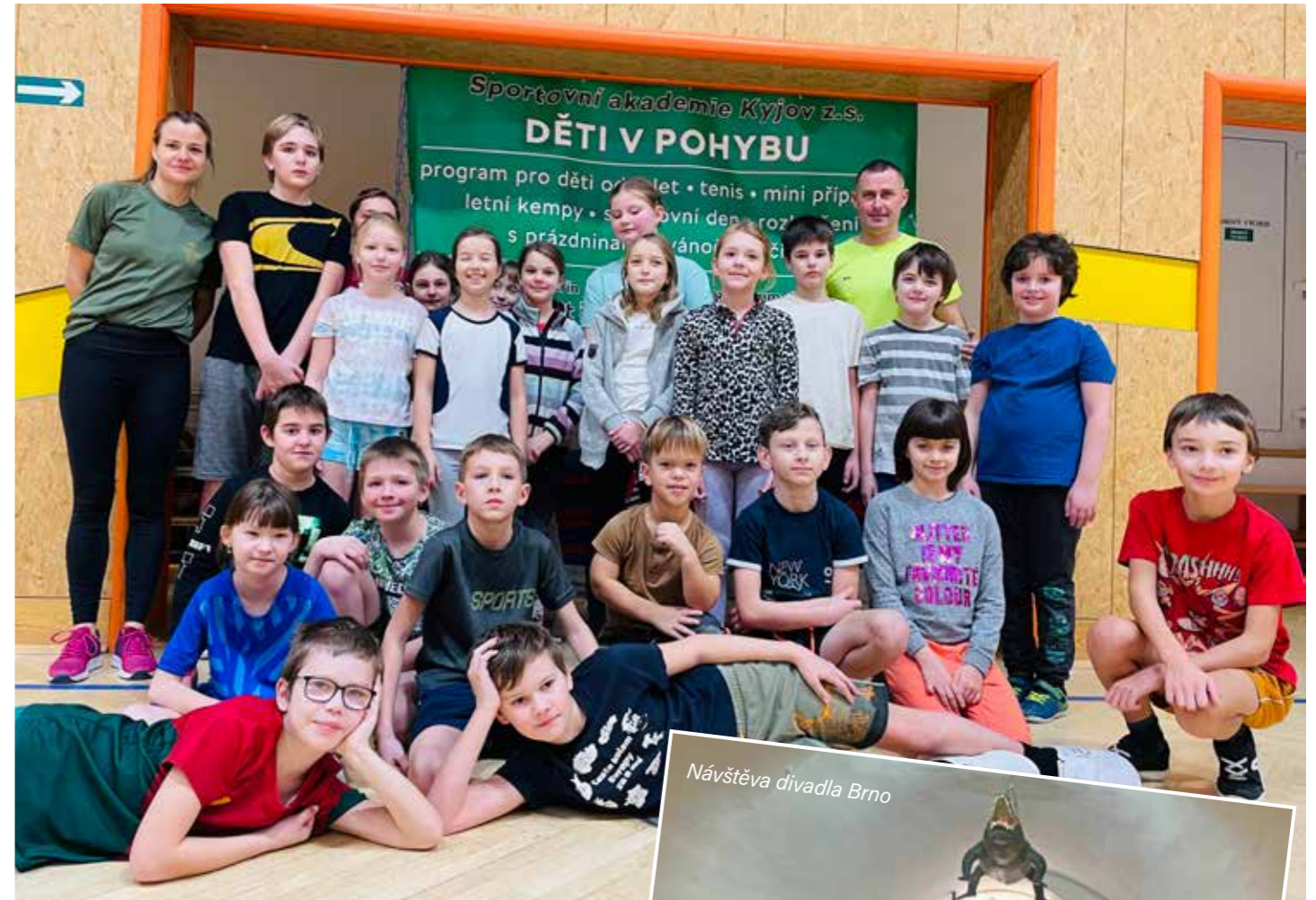
Děti v pohybu