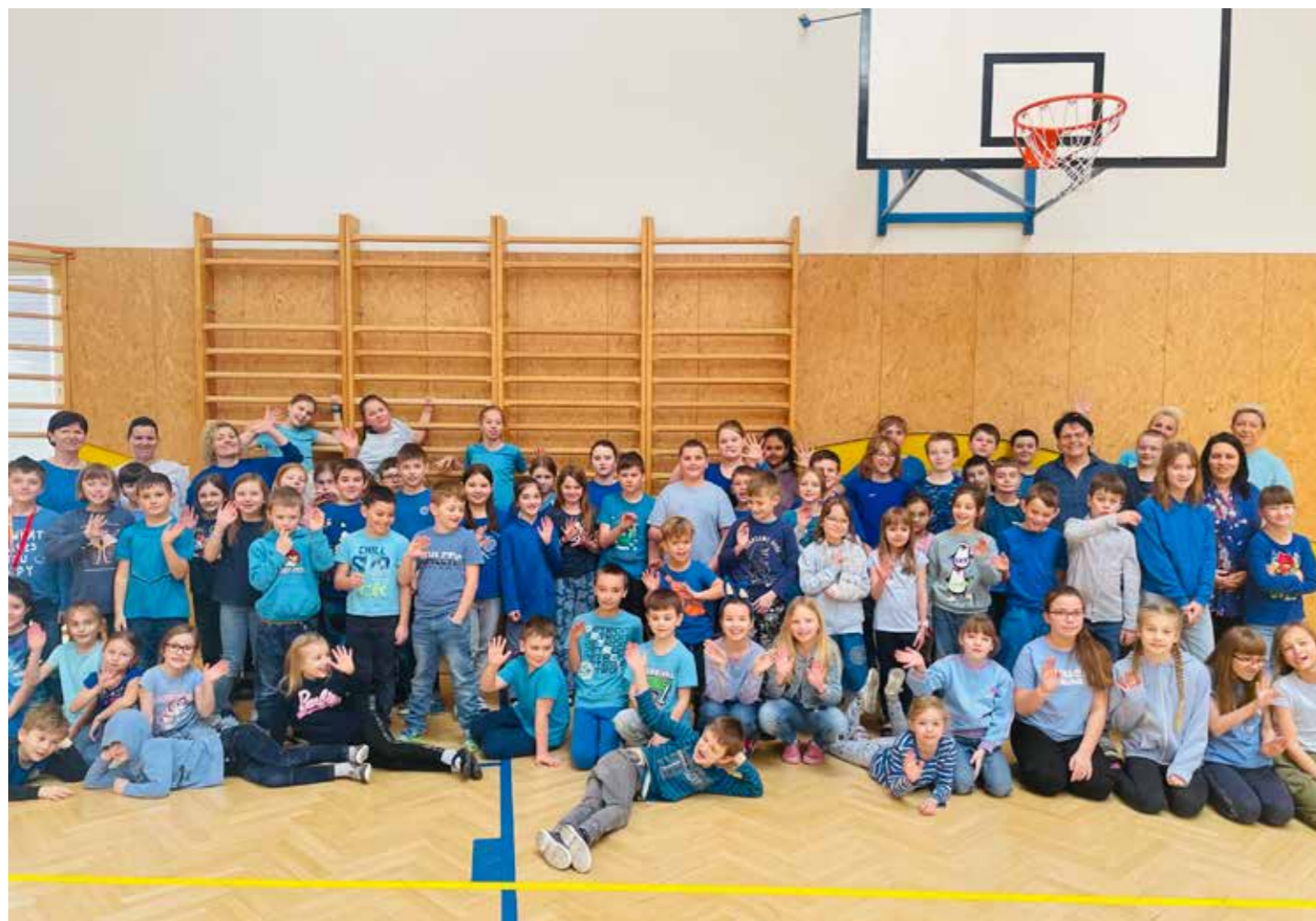
Barevný týden – modrá

Po novém roce čekalo děti kulturní překvapení v podobě divadelního představení „Z devatera pohádek“. Vtipné vystoupení nám předvedli herci z Divadélka pro školy z Hradce Králové, kterým se předlohou pro děj stala kniha Karla Čapka. Herci výše zmíněného divadla u nás hostují pravidelně a vždy velmi kladně hodnotíme jejich profesionální vystoupení a přístup.