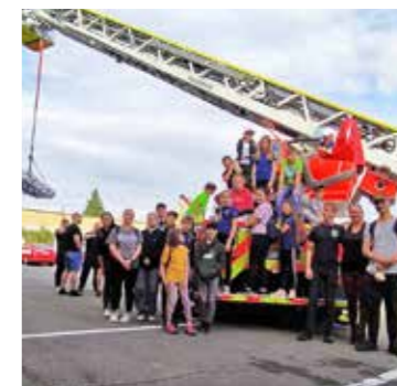
Návštěva hasičské stanice ve Vyškově