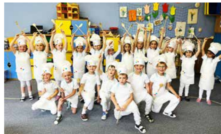
Kuchaři a kuchařinky přejí maminkám