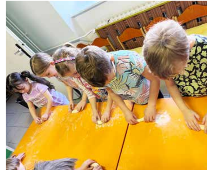
Pečení rohlíčků aneb hrajeme si na řemesla