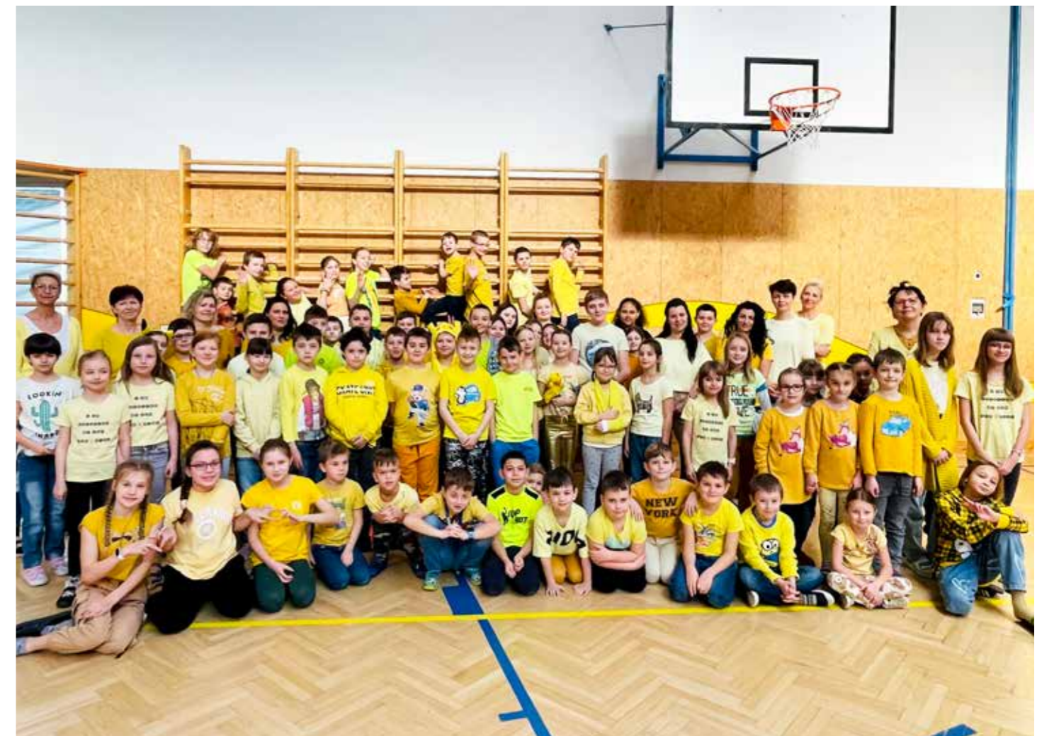
Barevný týden – žlutá