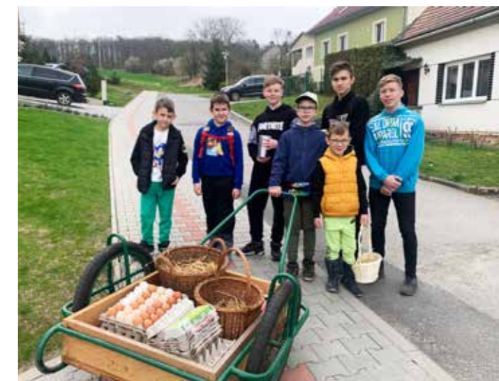
Koledníci z Letošova