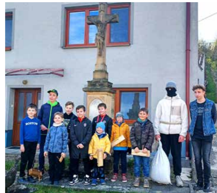
Nesováci s Jidášem