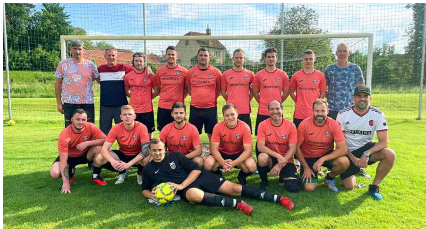
A tým Nesovice

Nezapomínáme také na činnost s naší fotbalovou mládeží. Vedoucí naší přípravky odvádějí kus dobré práce a pokračují v zavedeném systému tréninků na fotbalovém hřišti a v zimě ve školní tělocvičně. Děti sportování baví a účast je stále na velmi dobré úrovni. Trénuje se každý čtvrtek, na Facebooku má naše příprava svoji skupinu. Pokud máte zájem a chcete přihlásit i vaše děti, tak jednoduše přijďte na trénink nebo napište zprávu na skupinu. Nyní jsou již v provozu také všechna venkovní sportoviště. Přímo u nich je organizační řád s ceníkem a kontakty na klíčové osoby.