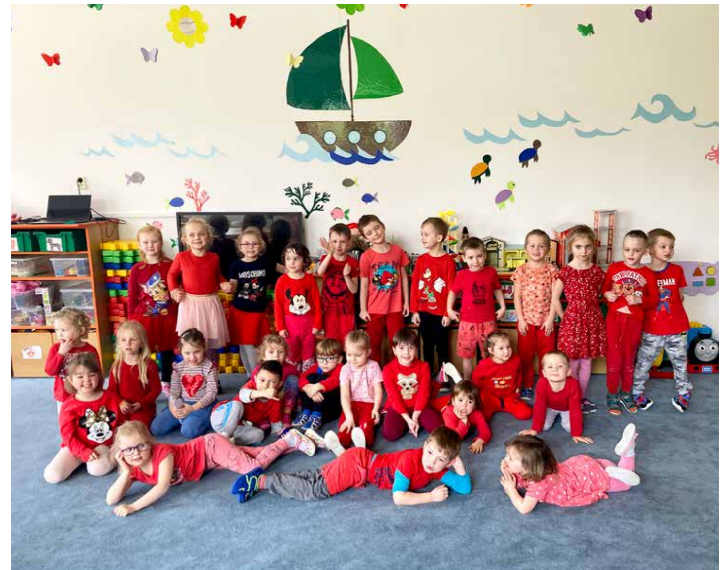
Červená středa ve školce

Březen – za kamna vlezem. To se jen tak říká. Ale ve školce to neplatí. Paní ředitelka nás pozvala do školy, abychom si z keramiky vyrobili dárek pro maminky. Navštívili jsme místní knihovnu, kde nás přivítaly paní knihovnice a ukázaly nám nové knihy pro děti. Půjčily nám do školky pohádky na čtení po obědě. Také jsme se naučili kouzlit od pana kouzelníka, který nám jedno tajné kouzlo prozradil. Ale Vám ho neřekneme, to by ho potom uměl každý. Poslední týden v březnu se nesl ve znamení Velikonoc.