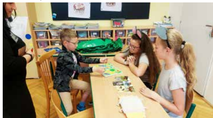
Zápis do 1. třídy