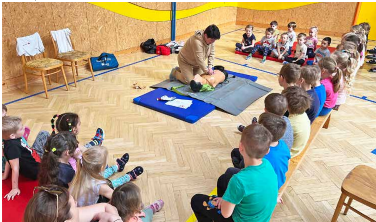
Divadélko o první pomoci