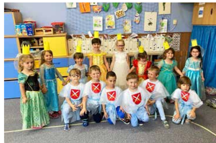
Princové a princezny – Den matek