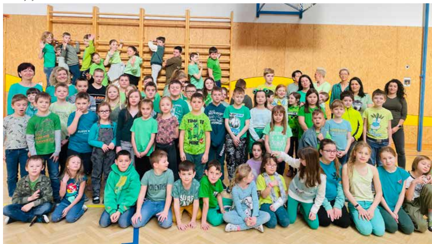
Barevný týden – zelená