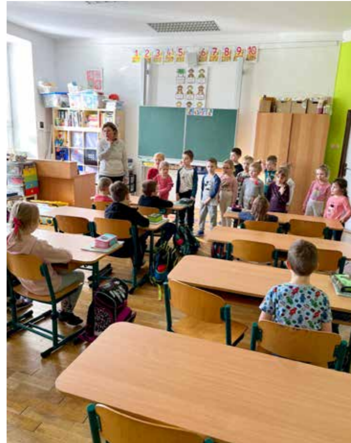
Návštěva v první třídě