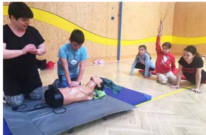
Divadélko 1. pomoci