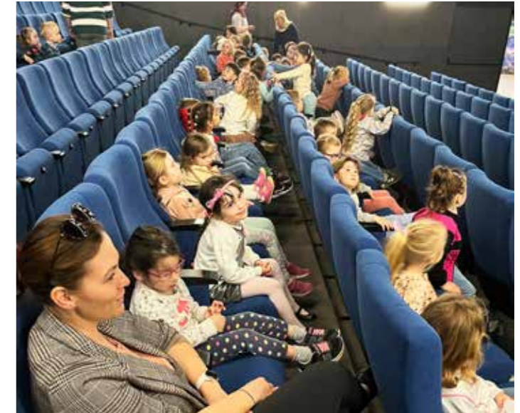
Návštěva kina – Mlsné medvědi příběhy