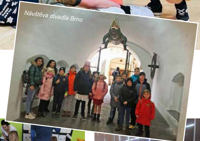
Návštěva divadla Brno