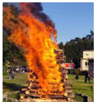
Pálení čarodějnic areál 2024