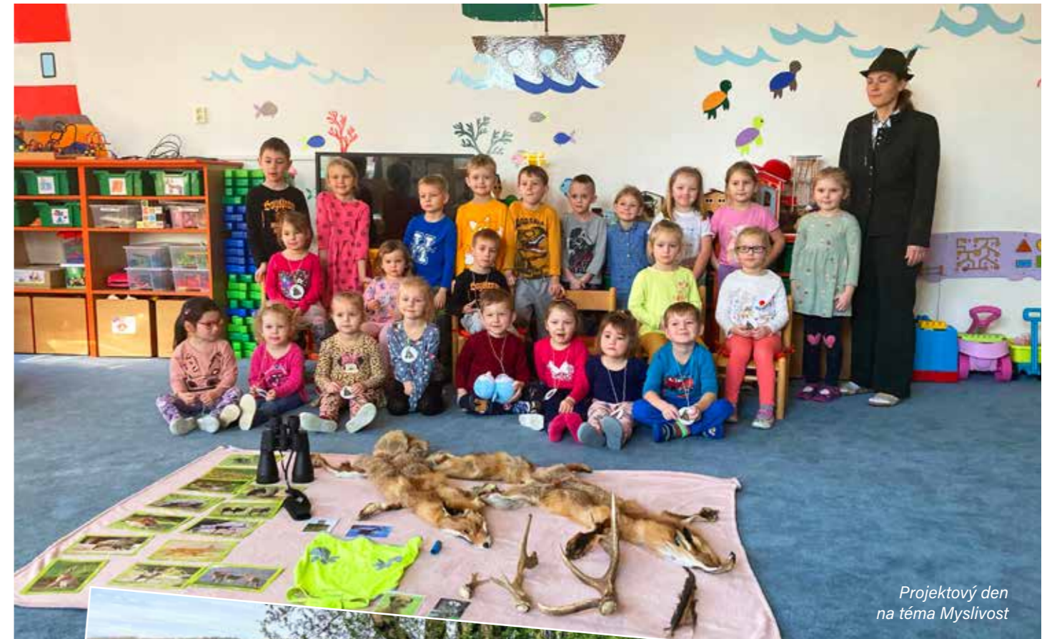
Projektový den na téma Myslivost