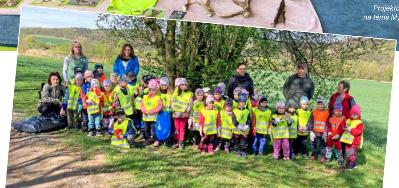
Uklízíme si Česko