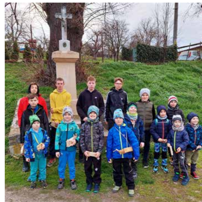
Hrkači Nové Zámky

Za to patří velké díky nesovickým chlapcům.