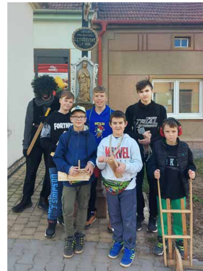
Letošováci s Jidášem