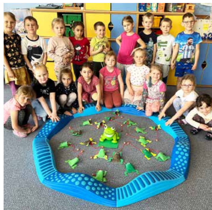
Náš rybníček plný žabiček