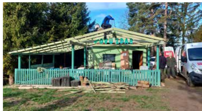
Stavební úpravy myslivecké chaty