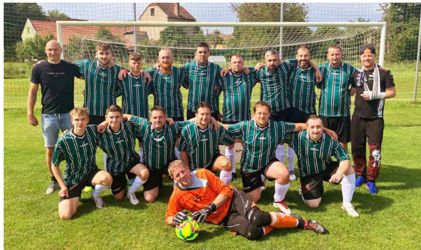
B tým Nesovice